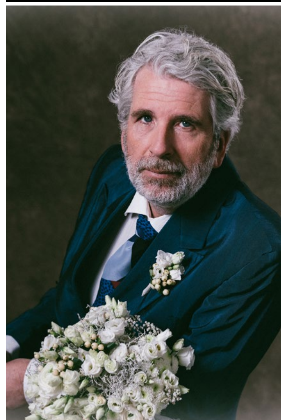
19.3.2023 | KAMMERSPIELE DIRK STERMANN „ZUSAMMENBRAUT“ DAS ERSTE KABARETT-SOLO VON DIRK STERMANN