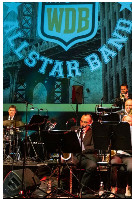
15.2.2023 | GROSSER SAAL MUSIKTHEATER WOODSTOCK ALLSTAR BAND „A TRIBUTE TO JAMES LAST“ WOODSTOCK DER BLASMUSIK

Bitte informieren Sie sich auf landestheater-linz.at über die stets aktualisierten Gastspiele