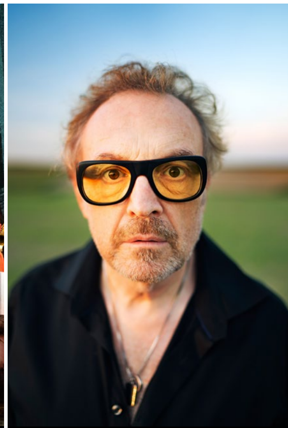
20.2. | 6.3. | 20.4.2023 | GROSSER SAAL MUSIKTHEATER JOSEF HADER „HADER ON ICE“