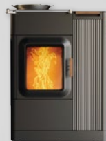
NEU! MO DUO COOK → Holzschelte & Pellet