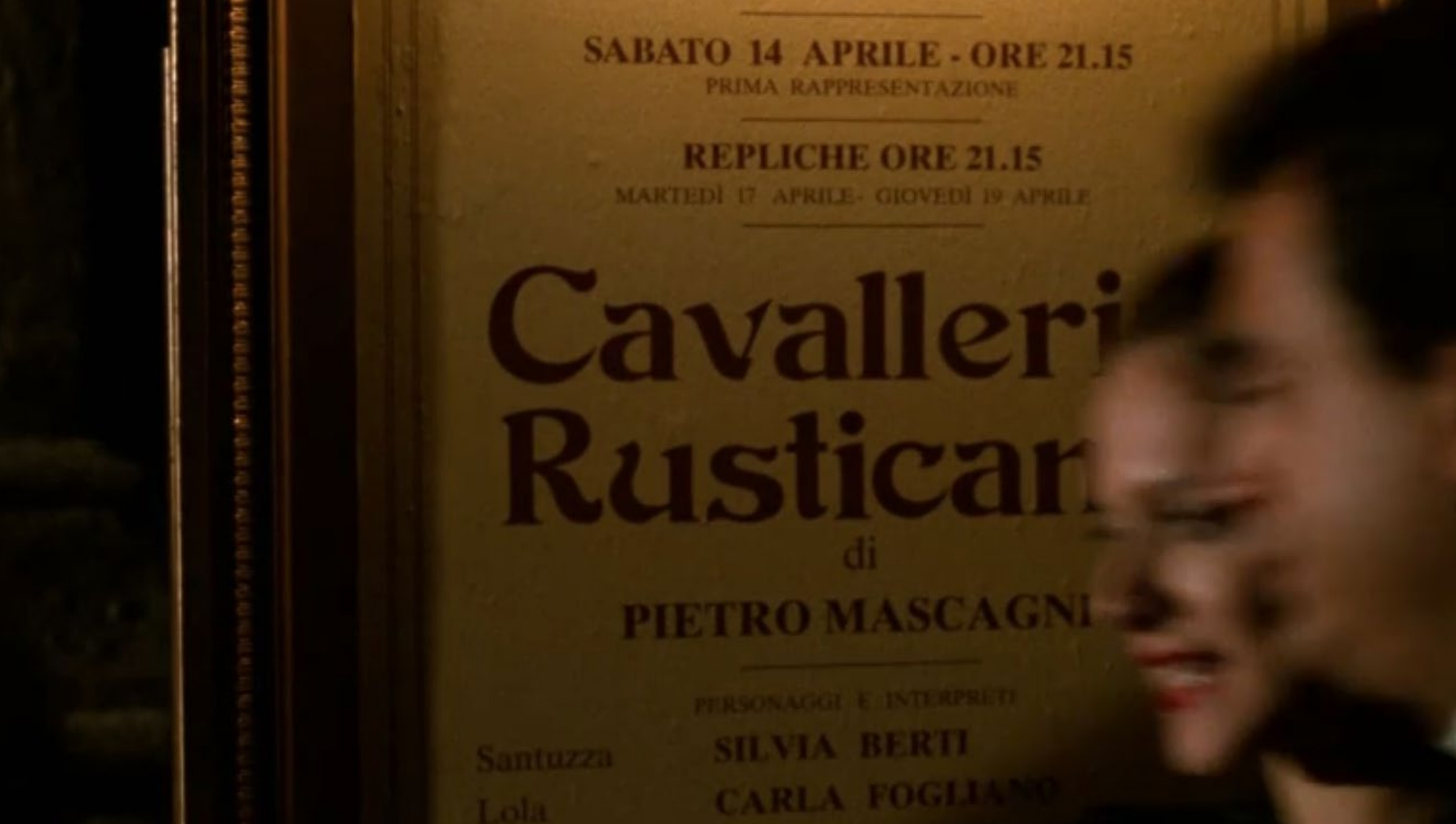
Der Pate III, 1990

Gemeint sind damit gern auch überbordende Gefühle, eben jene Überwältigungen, die einerseits für Musikdramen so typisch sind und die andererseits kodiert sind als „typisch italienisch“.