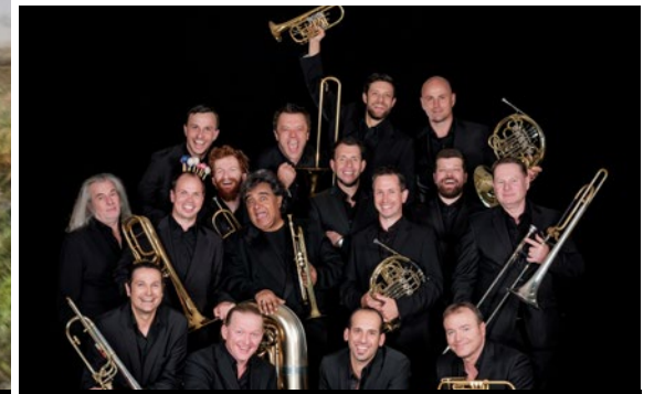
19. NOVEMBER | GROSSER SAAL MUSIKTHEATER PRO BRASS – 40 JAHRE PRO BRASS „BEST OF“