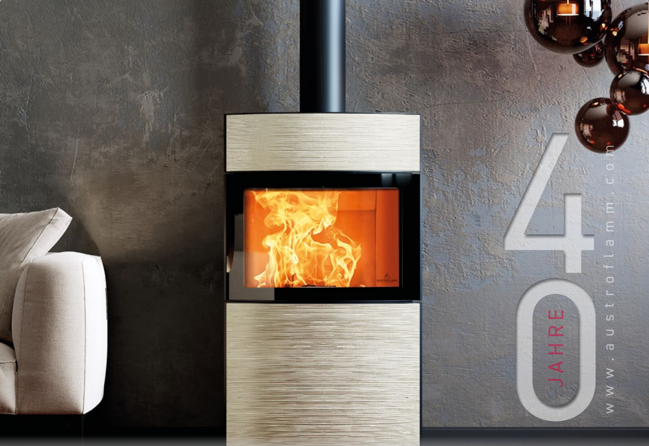
NEU! FYNN XTRA „Rille Mondstein glänzend“ → Holzschelte

JETZT IN DER BLACKBOX LANDESTHEATER-LINZ.AT