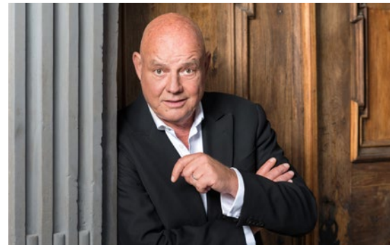
9. DEZEMBER | BLACKBOX MUSIKTHEATER BÖCK | GASSELSBERGER | LINECKER „WEIHNACHTEN IST ÜBERALL ...“