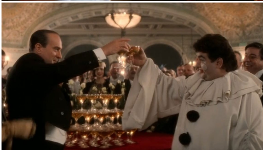
Die Unbestechlichen, 1976

staunlich berührenden Aufführung von Pagliacci im Kolosseum in Rom mündet – inklusive einer ausgesprochen anrührenden Darbietung von „Vesti la giubba“. Am Rande sei bemerkt, dass die ganze Episode auf den Filmklassiker Charlie staubt Millionen ab ( The Italian Job ) mit Michael Caine aus dem Jahr 1969 anspielt.