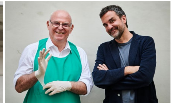
9. NOVEMBER | SCHAUSPIELHAUS KLENK + REITER MIT ERNST MOLDEN „ES WIRD A LEICH' SEIN“