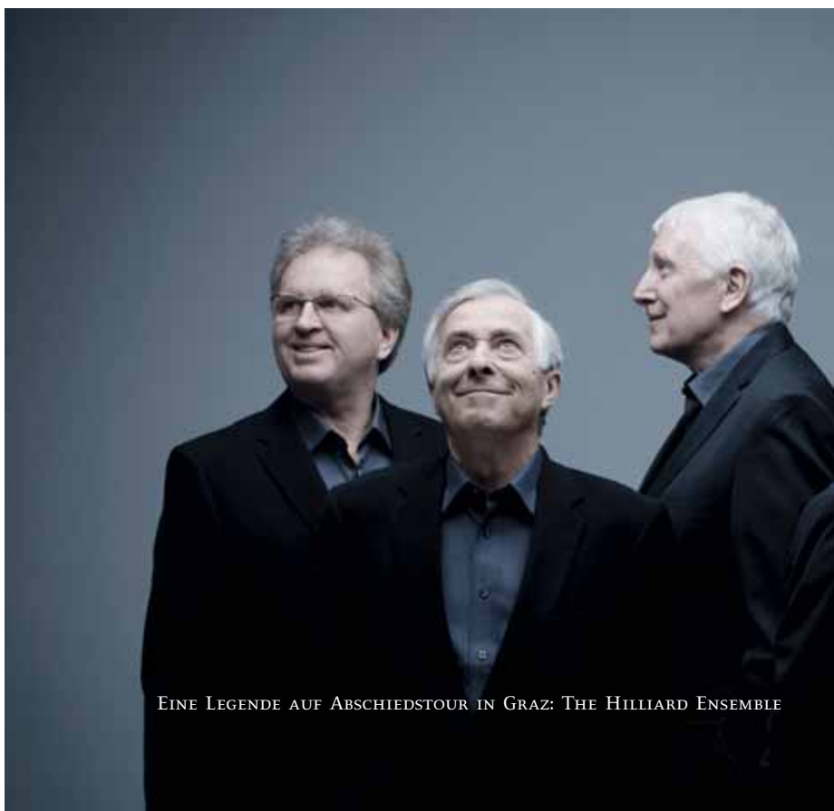
EINE LEGENDE AUF ABSCHIEDSTOUR IN GRAZ: THE HILLIARD ENSEMBLE

Chöre und Vokalensembles verteilen sich auf idyllische Plätze rund um den Stainzer Schlosshof, wo der Arnold Schoenberg Chor Schumann und Brahms singt: „Frisch auf zum fröhlichen Jagen“ und „Waldesnacht, du wunderkühle“. Englische Madrigale erklingen im barocken Rosengarten, Mendelssohns Lieder „im Freien zu singen“ im Schenkkellergarten, Geistliches von Brahms in der Stainzer Kirche. Zur Jause im Pfarrgärtlein darf Schuberts „Lindenbaum“ nicht fehlen. Zum Abschluss treffen sich alle wieder im Schlosshof zum Abendständchen von Brahms. Ein Eröffnungsfest wie aus der guten alten Zeit des Chorgesangs.