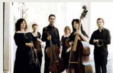
IL CONCERTO VIENNESE