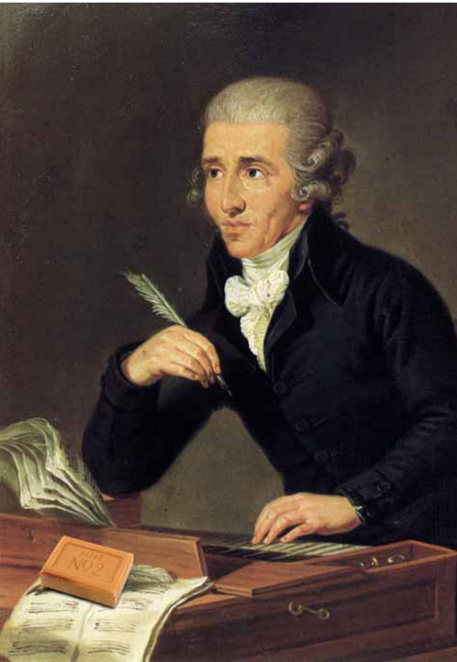
JOSEPH HAYDN KOMPONIERT. ÖLGEMÄLDE VON LUDWIG GUTTENBRUNN, 1791-92, EINE VOM KÜNSTLER SELBST ÜBERARBEITETE VERSION DES ORIGINALS AUS 1770.

Haydn mit der Hofkapelle ausharren, bis es den Fürsten wieder nach Eisenstadt zog - mitunter eine anstrengend lange Zeit, die sich Haydn durch Komponieren versüßte. Dabei hat er so manchen rustikalen Einfall aufgeschnappt, den er in seinen Werken verarbeitet: den Gesang der Vögel und das Galoppieren der Pferde, einen ungarischen Bauerntanz und das Lied von den Sauschneidern.