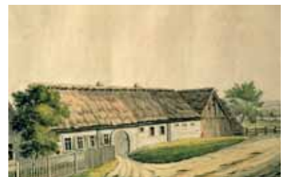
HAYDNS GEBURTSHAUS IN ROHRAU STEHT HEUTE NOCH UND WIRD DER SPIELPLATZ DER „AUSSENWETTE“ IN DER HAYDN-SOAP.