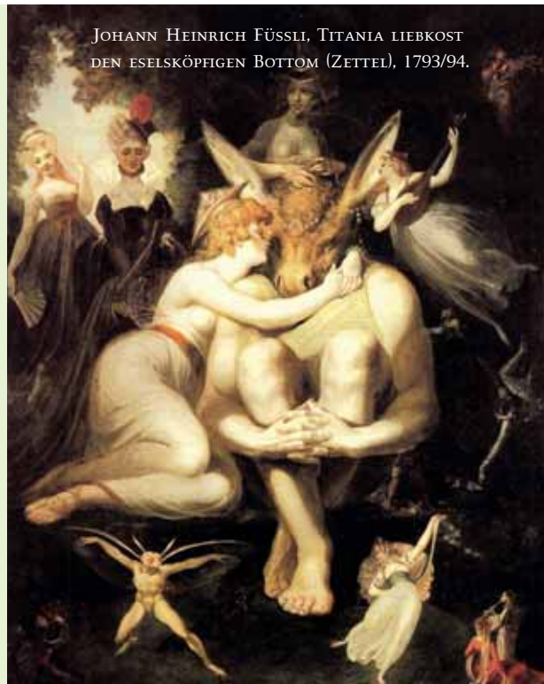
JOHANN HEINRICH FÜSSLI, TITANIA LIEBKOST DEN ESELSKÖPFIGEN BOTTOM (ZETTEL), 1793/94.

Karten & Informationen: Tel. 0316.825000 www.styriarte.com