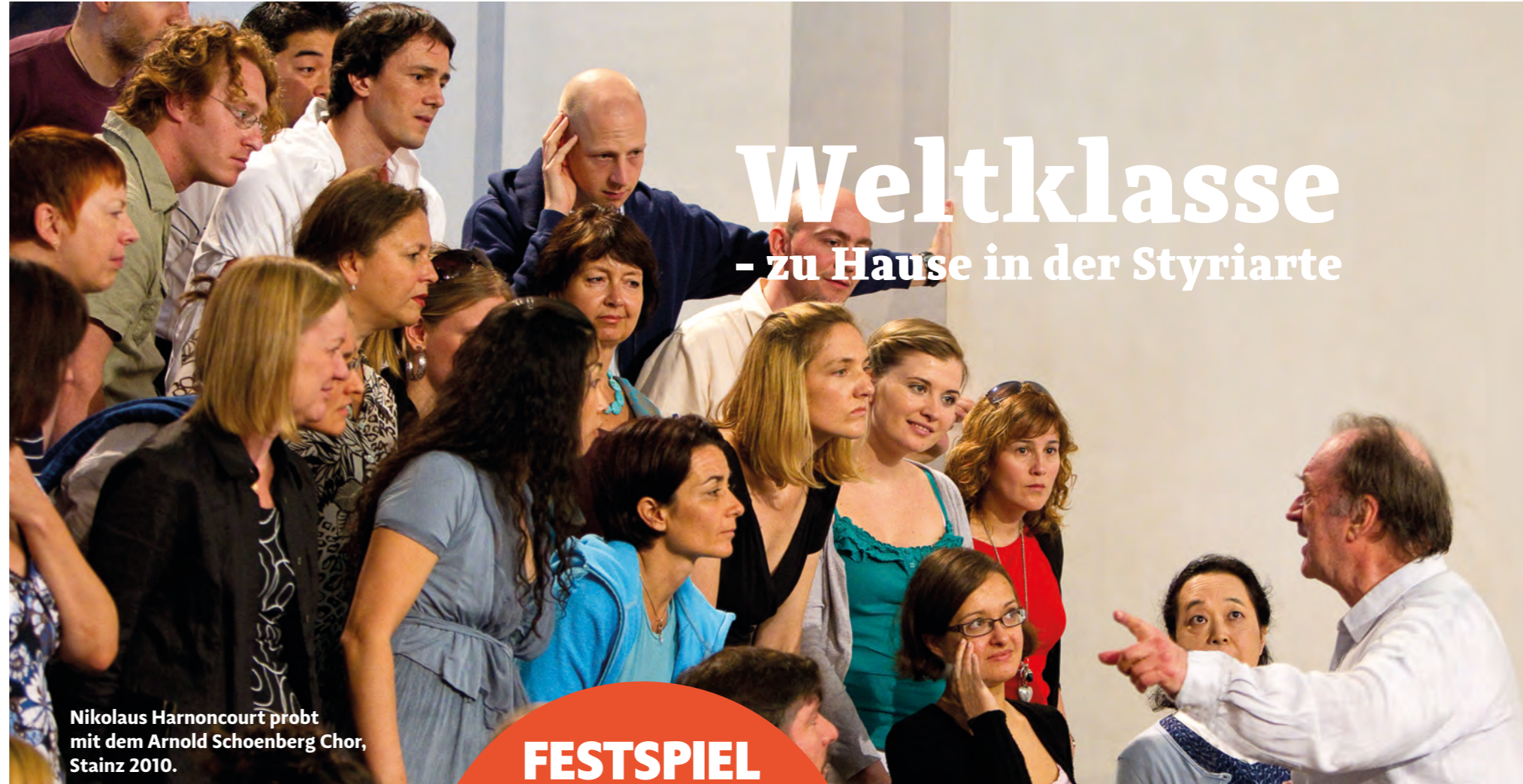
Nikolaus Harnoncourt probt mit dem Arnold Schoenberg Chor, Stainz 2010.

Wer dabei war, wird diese Momente nie vergessen: „Es lacht der Mai, der Wald ist frei von Eis und Reifgehänge!“ jubelten die Frauenstimmen in der „Ersten Walpurgisnacht“ von Mendelssohn – unter Harnoncourt das schönste Loblied auf den Frühling. Kurz danach entfesselten die Männerstimmen ein Pandämonium der Gespensterklänge: „Kommt mit Zacken und mit Gabeln“. Den Hymnus am Ende sangen alle zusammen mit einer Klangfülle, die dem Finale einer Mahler-Sinfonie zur Ehre gereicht hätte: „Dein Licht, wer kann es rauben?“ Immer wieder hat der Arnold Schoenberg Chor unter Harnoncourt die Erlösungsmo-