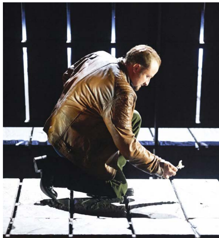
Richard Wagner ist der Hauptkomponist auf dem neuen Album. An der Wiener Staatsoper feierte der Tenor vor zwei Jahren sein Rollendebüt als Erik im »Fliegenden Holländer«