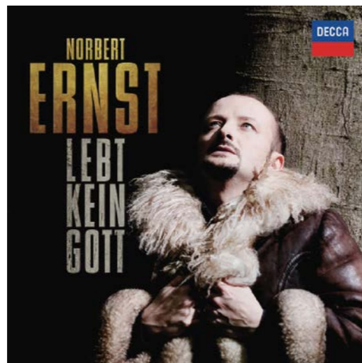
Auf der neuen CD verfolgt Ernst mit dem Brandenburgischen Staatsorchester eine authentische Klangästhetik

in Montpellier, wo er sein Debüt als Lohengrin feierte. Die Franzosen waren angetan, ihnen gefiel Ernsts warmes Timbre. Ein Kritiker schrieb, seine Stimme sei »aus Samt und Honig mit warmer und sonniger Farbe«, wo-